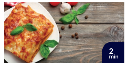
Återuppvärmd Lasagne tillagad på 2 min