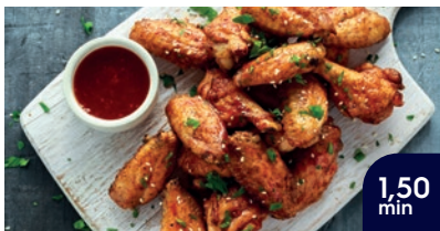
Regenererade kyckling- vingar tillagas på 1,50 min