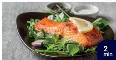
Färsk laxfilé på 2 min