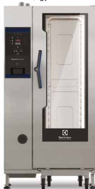
SkyLine Premium kombipároló, 20 GN 1/1, elektromos