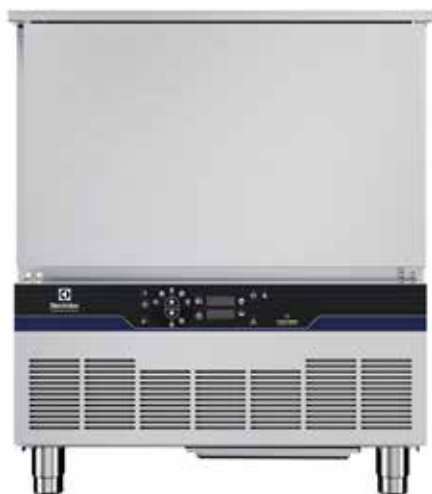
Keresztálcás sokkoló hűtő-fagyasztó, 15 kg, 5 GN 1/1 (R290)

Élvezze a friss és biztonságos élelmiszereket hosszabb ideig a tartós megoldásunkkal: a minőség, a hatékonyság és a költségmegtakarítás érdekében optimalizálva