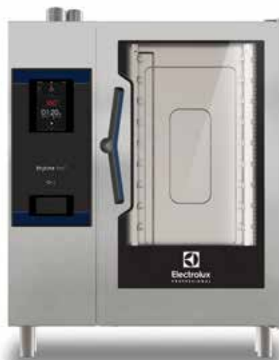
SkyLine Pro S kombipároló, 10 GN 1/1, elektromos