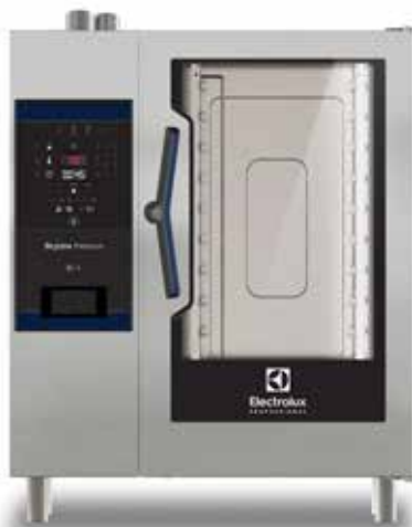
SkyLine Premium kombipároló, 10 GN 1/1, elektromos