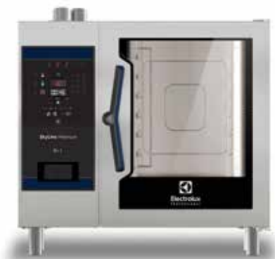
SkyLine Premium kombipároló, 6 GN 1/1, elektromos

A nélkülözhetetlen, nagy teljesítményű kombipároló a nagy igénybevételű konyhák számára. A piacon egyedülállóként digitális panellel és Lambda szenzorral rendelkezik, így biztosítva az extra pontos és valós idejű vezérlést.