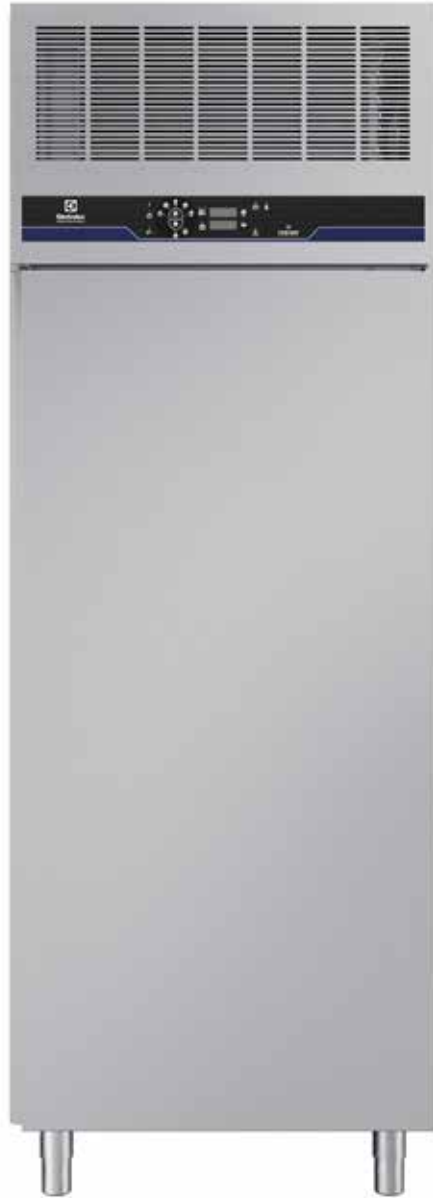
Keresztlécás sokkoló hűtő-fagyasztó, 100 kg, 20 GN 1/1 (R452A)