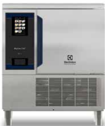
SkyLine Chill S sokkoló hűtő/ fagyasztó, 6 GN 1/1, 30/30 kg (R290)

Optimalizált munkafolyamat, megnövelt termelékenység és élelmiszerköltség megtakarítás vállalkozása számára