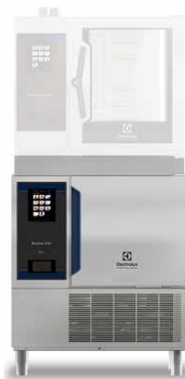
Skyline Chill S sokkoló hűtő/fagyasztó, 6 GN 1/1, 30/30 kg, torony installációhoz (R290)