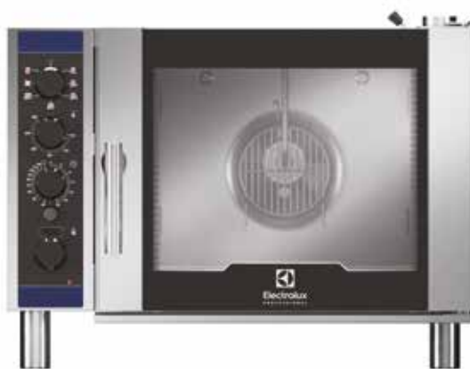
Smart Steam légkeveréses sütő, 6 GN 1/1, elektromos

Professzionális légkeveréses sütőink kiváló ár-érték arányt kínálnak. Erős kialakításuknak és megbízható teljesítményüknek köszönhetően egyenletes főzési eredmény érhető el, olyan egyszerűen, mint korábban még soha.