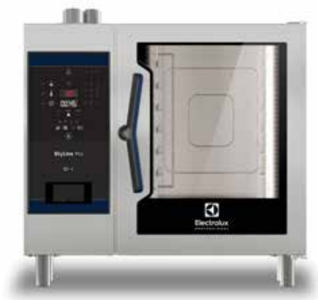
SkyLine Pro kombipároló, 6 GN 1/1, elektromos

Egy egyszerűen kezelhető, robusztus, flexibilis partner a konyhájában, amely a könnyű kezelhetőség érdekében digitális vezérlőpanellel rendelkezik.