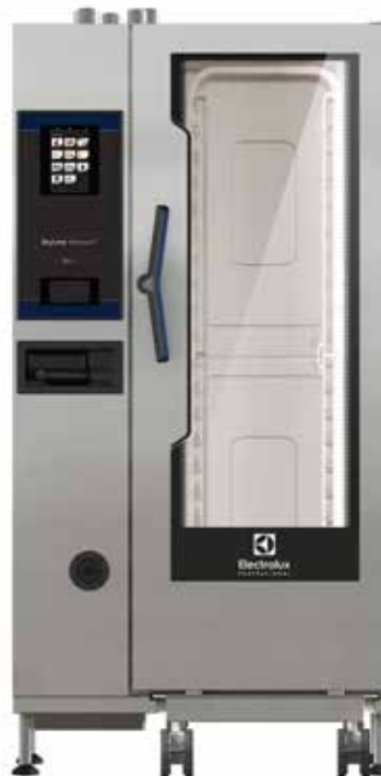
SkyLine Premium S kombipároló, 20 GN 1/1, elektromos