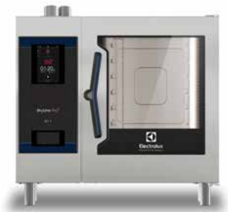
SkyLine Pro S kombipároló, 6 GN 1/1, elektromos

Kiemelkedő teljesítmény és a kategóriájában legjobb használhatóság a hagyományos főzéshez, a SkyLine Pro S a tökéletes bojler nélküli kombisütő az Ön vállalkozása számára.