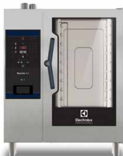
SkyLine Pro kombipároló, 10 GN 1/1, elektromos