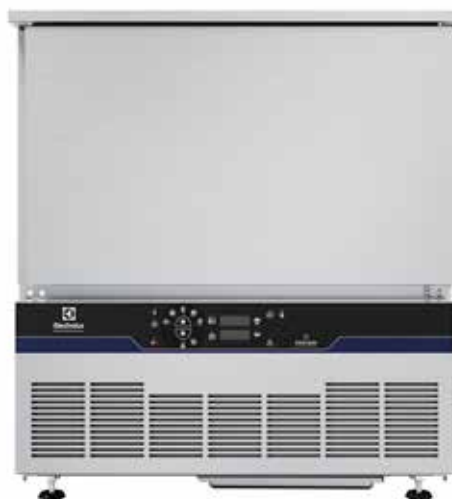
Keresztálcás sokkoló hűtő-fagyasztó, 15 kg, 5 GN 1/1, pult alatti kivitel (R290)