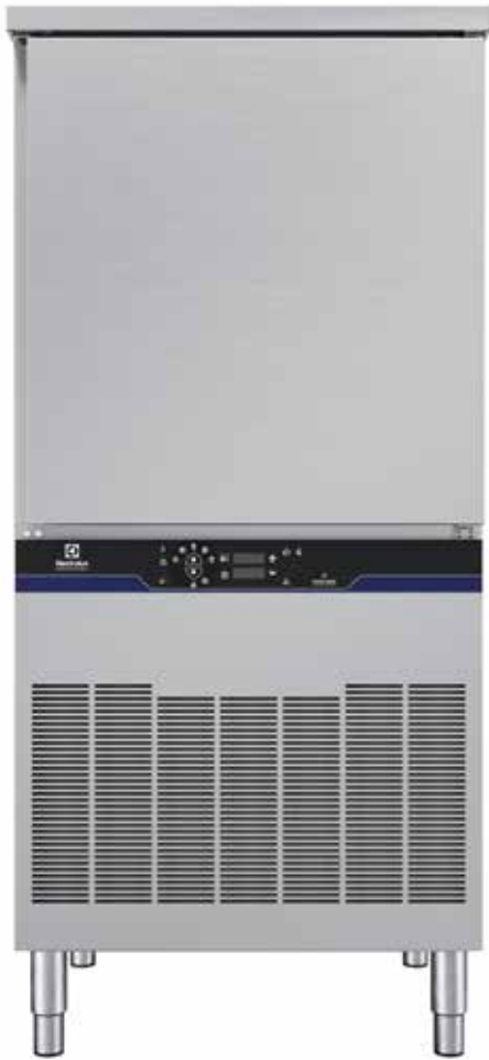
Keresztlécás sokkoló hűtő-fagyasztó, 40 kg, 10 GN 1/1 (R290)