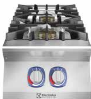
Gornji element plinskog štednjaka s dvama plamenicima