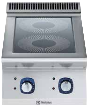
Indukcijska ploča za kuhanje s dvjema zonama (3,5 kW po zoni)

Uštedite energiju i uštedite na troškovima rada