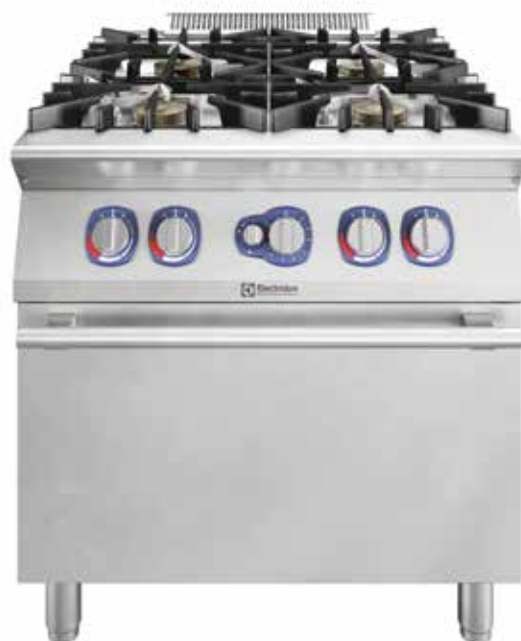
Plinski štednjak na plinskoj pećnici s četiri plamenika EcoFlame