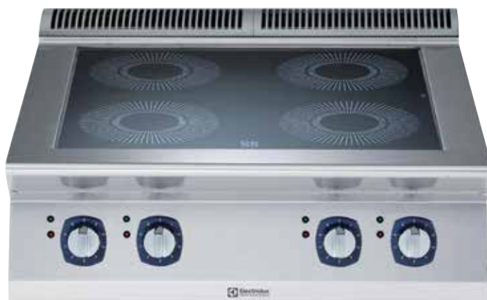
Indukcijska ploča za kuhanje s četirima zonama (3,5 kW po zoni)