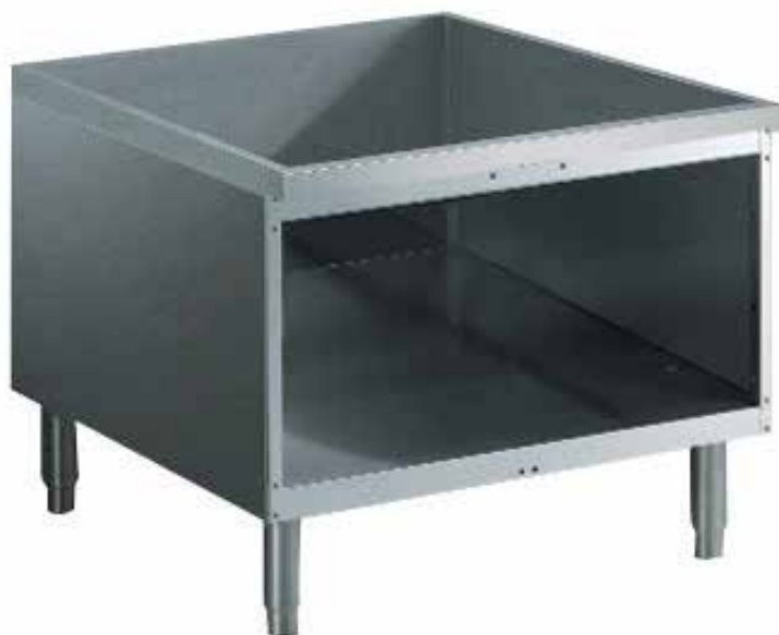
Otvoreno postolje 400 mm