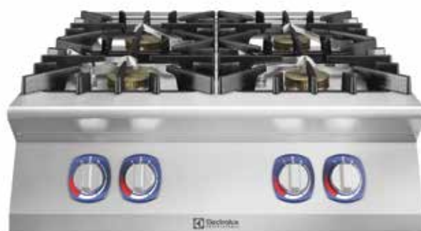
Gornji element plinskog štednjaka s četirima plamenicima