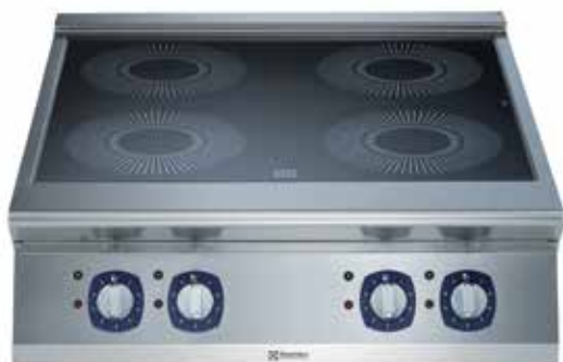
Indukcijska ploča za kuhanje s četirima zonama (5 kW po zoni)