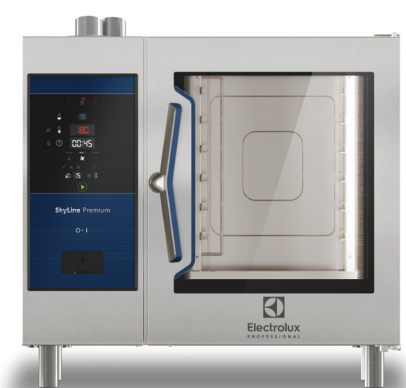
Pećnica SkyLine Premium 6 GN 1/1 električna

Nezaobilazna visokoučinkovita kombinirana pećnica za kuhinje s velikim radnim opterećenjem. Jedini uređaj na tržištu koji je opremljen digitalnim kontrolnim panelom i senzorom Lambda jamči vam iznimno precizno napredno upravljanje u stvarnom vremenu.