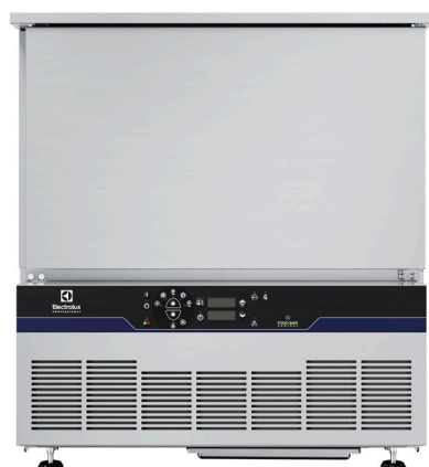
Šok hladnjak zamrzivač poprečni, podpultni - 15kg 5GN 1/1 - (R452A)

Preobrazite svoje poslovanje uz integrirana cjelovita rješenja tvrtke Electrolux Professional.