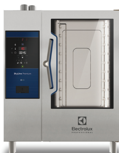
Pećnica SkyLine Premium 10 GN 1/1 električna