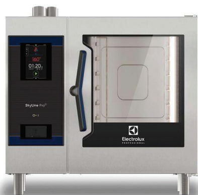
Električna kombinirana pećnica 6 GN 1/1