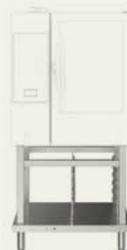
Otvoreno postolje za pećnice 6 i 10 GN 1/1