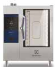
Električna kombinirana pećnica 10GN1/1