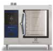
Električna kombinirana pećnica 6GN 1/1

Nezaobilazna visokoučinkovita kombinirana pećnica za kuhinje s velikim radnim opterećenjem. Jedini uređaj na tržištu koji je opremljen digitalnim kontrolnim panelom i senzorom Lambda jamči vam iznimno precizno napredno upravljanje u stvarnom vremenu.