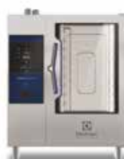
Električna kombinirana pećnica 10GN 1/1