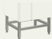
Podizač postolja za instalaciju pećnice 6GN1/1 na postolje 922612 s napom 922723