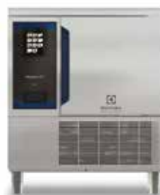
Šok hladnjak/ zamrzivač Chills 30/30 kg, 6 GN 1/1 ili 600 x 400 mm za samostalnu instalaciju