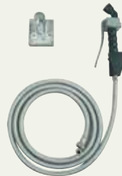
Vanjska slavina s tušem