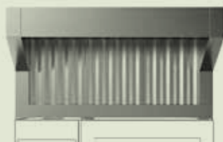
Kondenzacijska napa za pećnice 6 GN 1/1 ili 10 GN 1/1