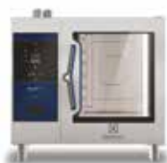
Električna kombinirana pećnica 6GN1/1