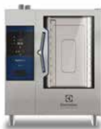
Električna kombinirana pećnica 10GN1/1