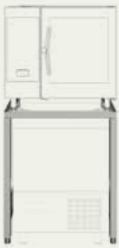
Posebno postolje za pećnicu 6GN1/1 na CW 5GN1/1 šok zamrzivaču