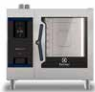
Električna kombinirana pećnica 6GN1/1