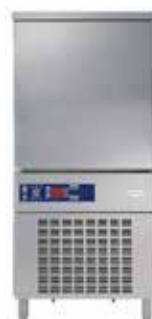
Poprečni šok hladnjak/zamrzivač 10xGN1/1, kapacitet hlađenja/ zamrzavanja: 32/28 kg