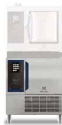
Šok hladnjak/ zamrzivač Chills 6GN1/1 za SkyDuo - tower instalacija (jedan uređaj na drugi)