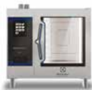
Električna kombinirana pećnica PremiumS 6GN1/1, Green/ zelena, za verziju SkyDuo

Jednostavan put prema učinkovitom, produktivnom kuhanju bez stresa. SkyLine PremiumS i SkyLine Chills: dva savršeno usklađena uređaja u potpunoj međusobnoj komunikaciji.