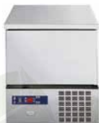
Poprečni šok hladnjak/zamrzivač 5xGN1/1, kapacitet hlađenja/ zamrzavanja: 12,5/7 kg

Preobrazite svoje poslovanje uz integrirana cjelovita rješenja tvrtke Electrolux Professional.