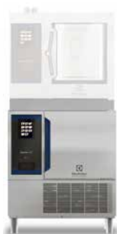
Šok hladnjak/ zamrzivač Chills 30/30 kg, 6 GN 1/1 ili 600 x 400 mm za tower instalacije