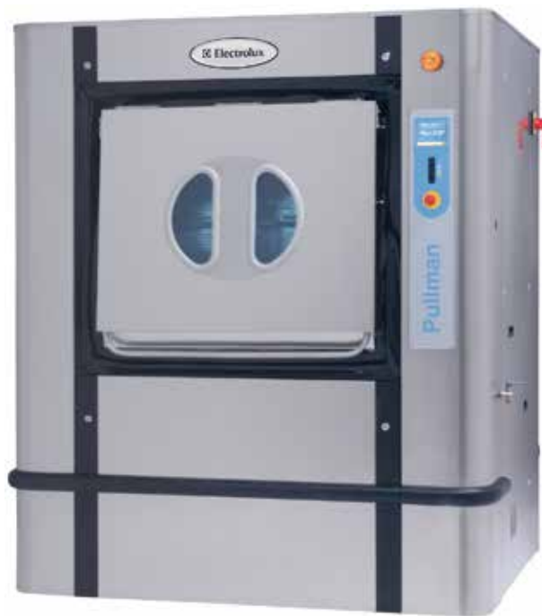
Les images fournies ont uniquement pour but de représenter le produit ; des différences peuvent donc exister.