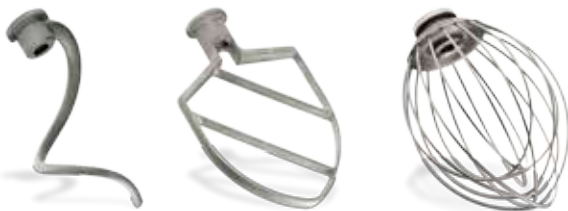
Taikinakoukku, sekoitusmela ja vispilä