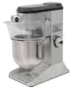
BE5 / BE8