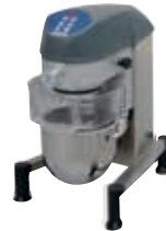
XBE / XBM pöytämallit