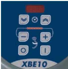
Kosketuspainikkeilla oleva käyttöpaneeli