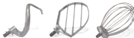
3 työkalua: taikinakoukku, sekoitusmela, vahvistettu vispilä (MB/MBE40)