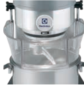
Läpinäkyvä turvasuojus (10 L)