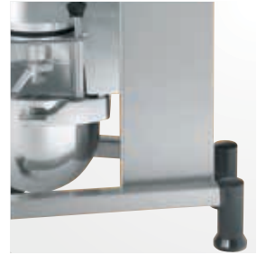
RST jalusta (valitut mallit)