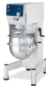
BMX / BMXE / XBE