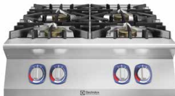
Sporák EcoFlame 4 plynové hořáky