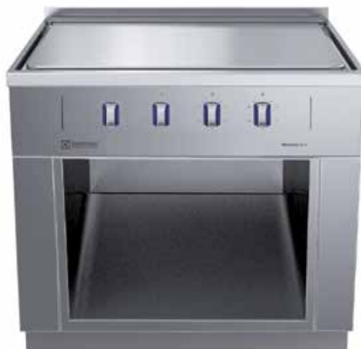
El. tálový sporák ECO solid top, 4 zóny, otevřená podstavba