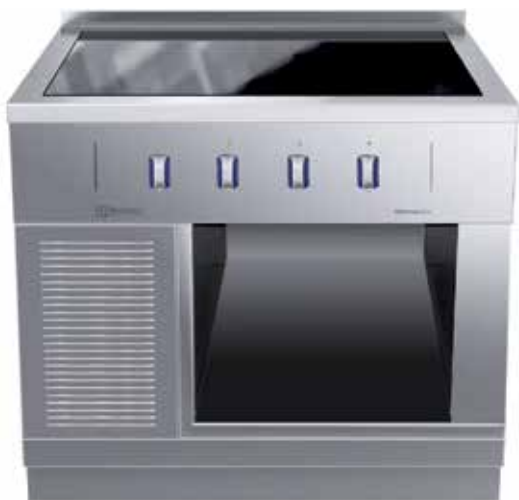
Indukce celoplošná, 4 zóny, otevřená podstavba